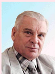
Александр Иванович ТАТАРКИН

академик РАН, директор Института экономики Уральского отделения РАН tatarkin_ai@mail.ru